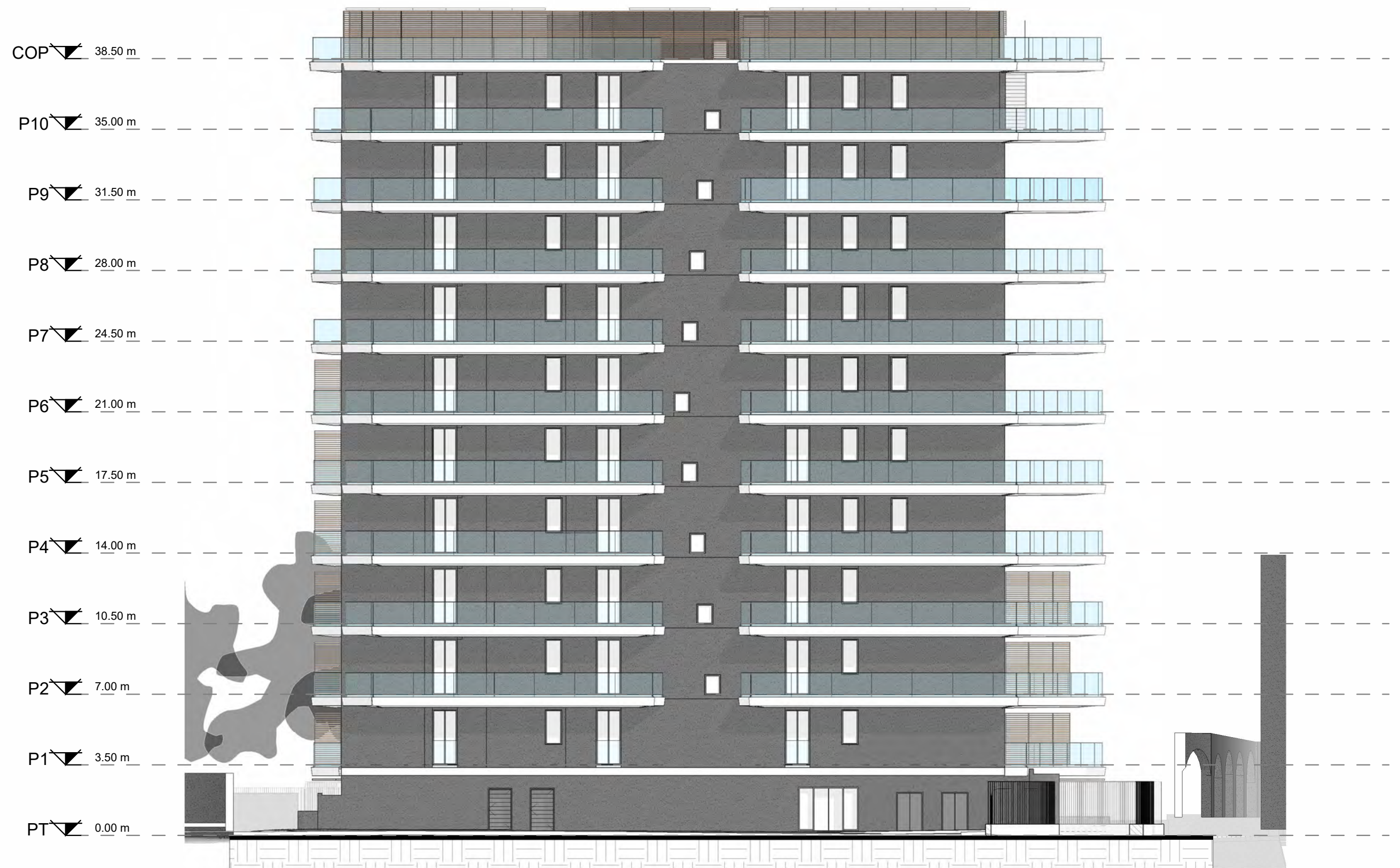
Prospetto Nord - Scala 1:200