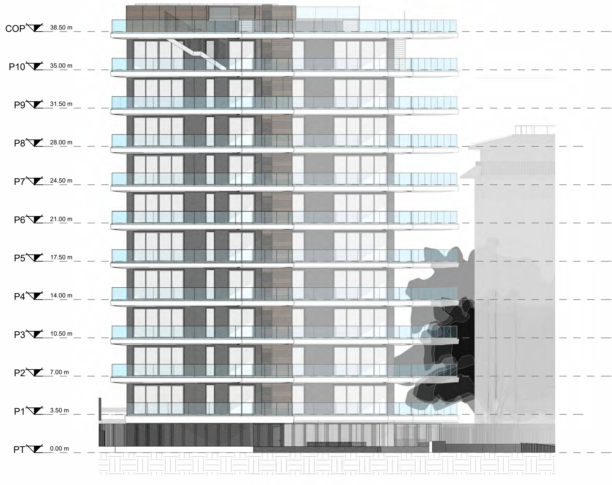
Prospetto Ovest - Scala 1:200