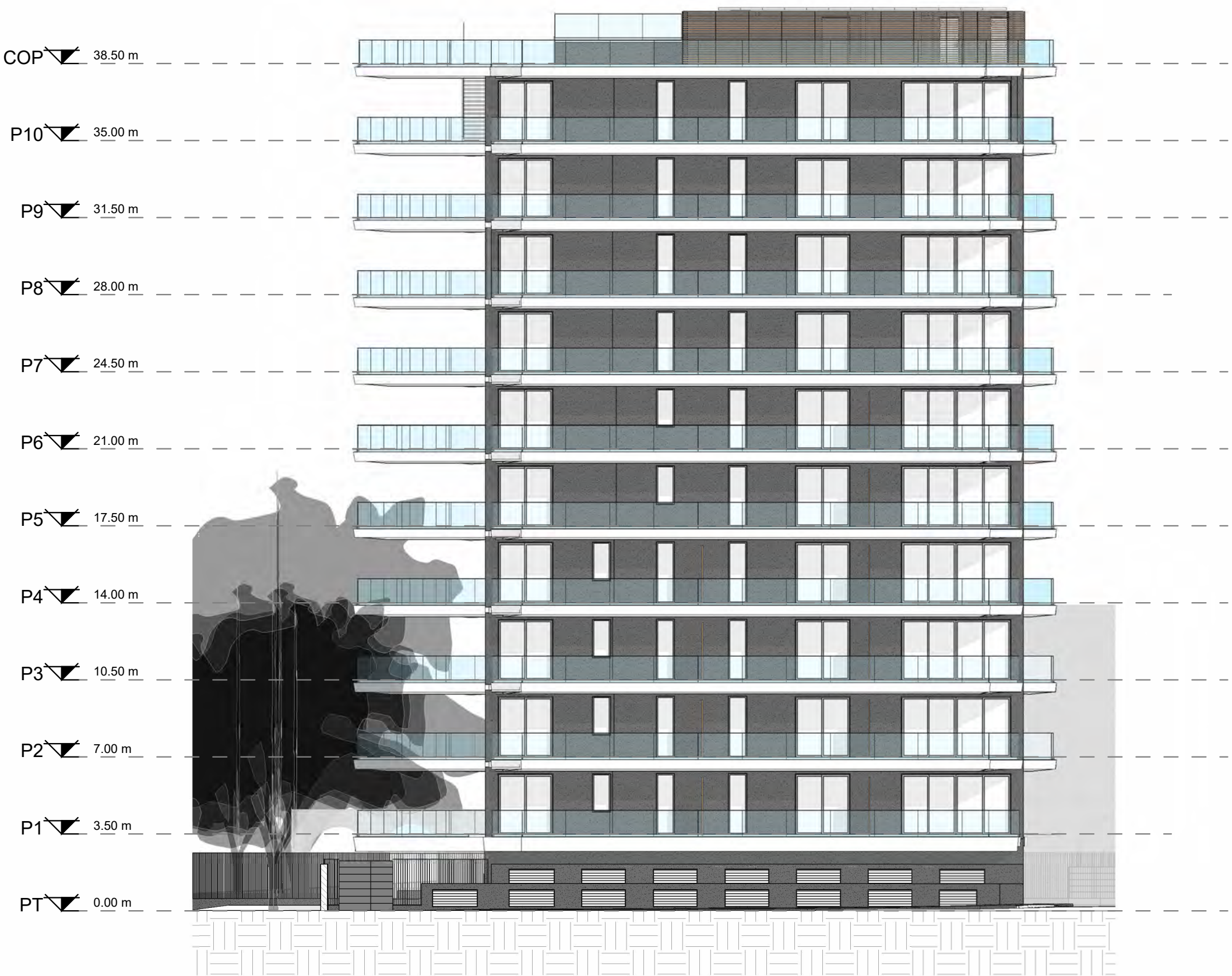
Prospetto Est - Scala 1:200