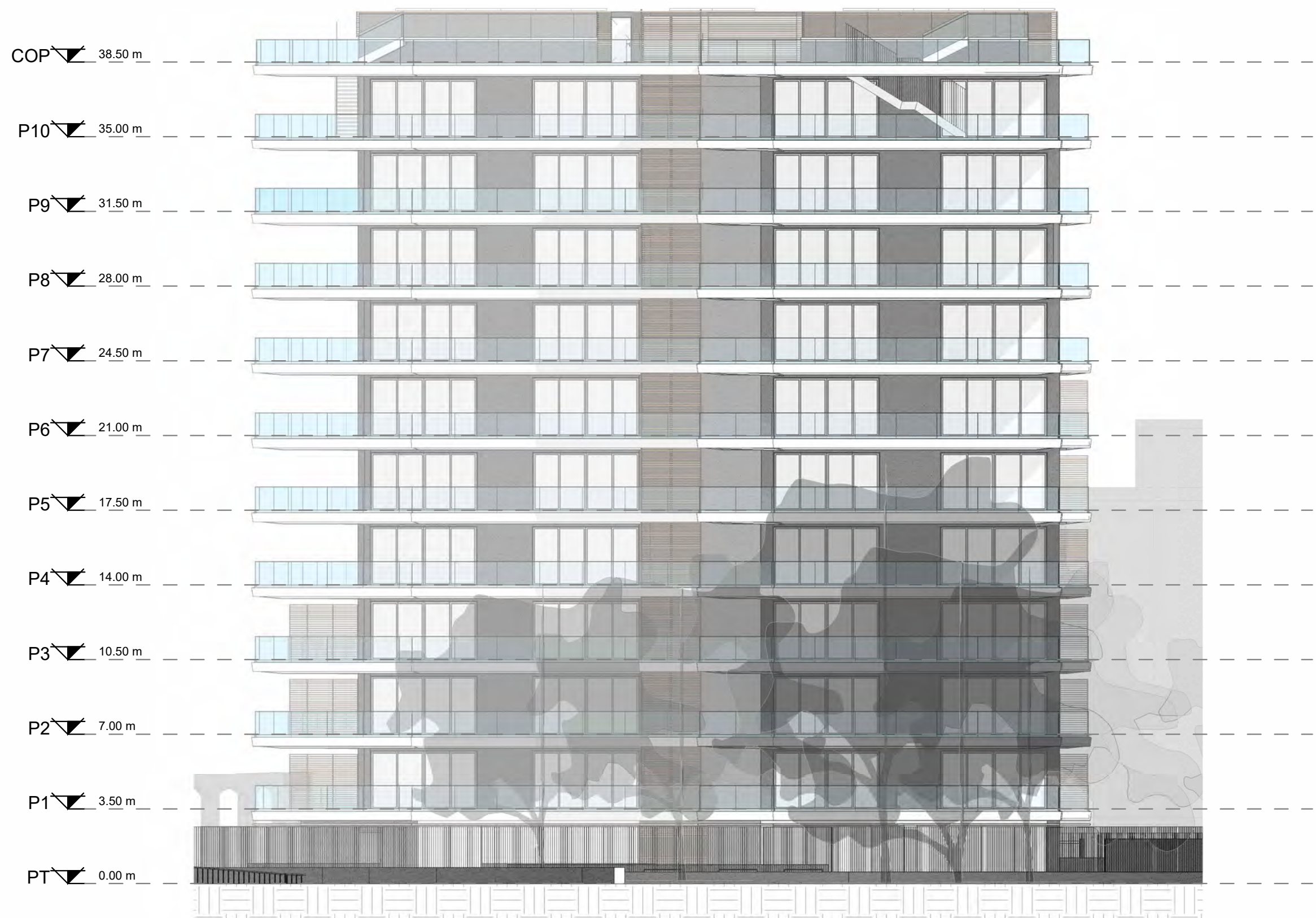
Prospetto Sud - Scala 1:200